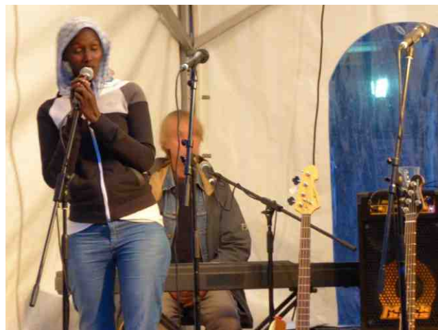
Auf der Bühne während der Floßtour

Deshalb fordern wir: Dublin III abschaffen! Jede Frau hat ein Recht auf Selbstbestimmung!