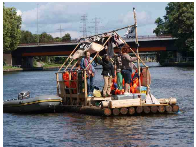
Travelling on one of the rafts during the tour

That's why we demand: Abolish Dublin III! Every woman has the right to self-determination!